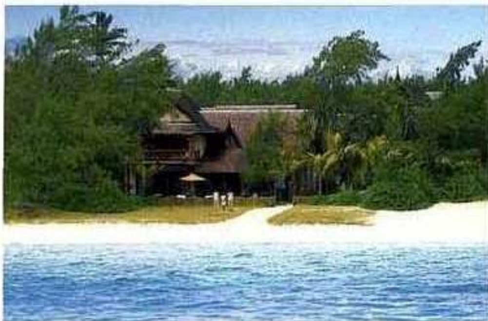
À la Villa Tiara, accès direct sur la plage de Poste Lafayette

• www.belleriviere.com - Tél. 06 16 64 16 04