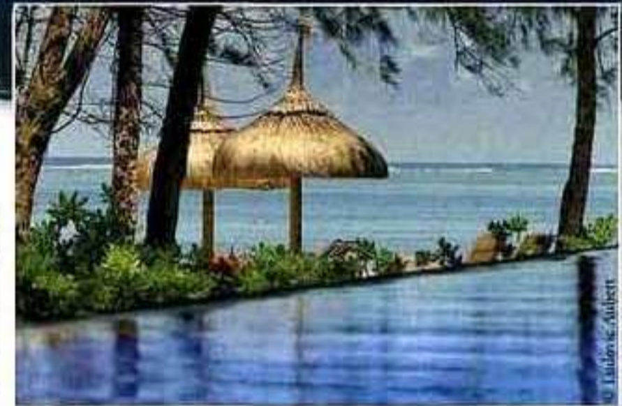
La mer à perte de vue au Sofitel So Mauritius Bel Ombre

sauna, plans d'eau...). À 600 m de la plage (villa la plus éloignée) mais avec une vue sur l'océan à couper le souffle, les propriétaires et locataires peuvent aussi bénéficier des services du Sofitel (restauration, accès au "plus beau spa du monde !"...) à des conditions privilégiées. Sur les 33 villas, deux sont encore proposées à la vente (environ deux millions d'euros) et 6 à 7 d'entre-elles sont accessibles à la location (de 1000€ à 2000€ la nuit en haute saison) pour une grande famille ou avec une bande d'amis. Et bien sûr, on peut aussi résider au Sofitel So Mauritius Bel Ombre. Ne pas